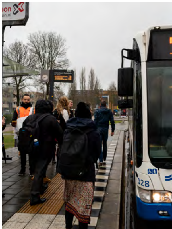
Start van bus 55