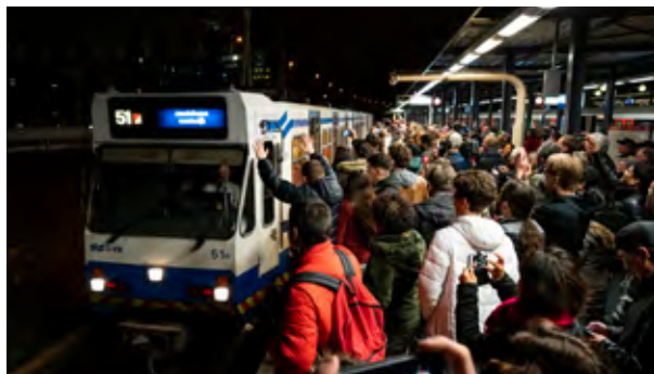
De laatste rit van de 51 op zondag 3 maart