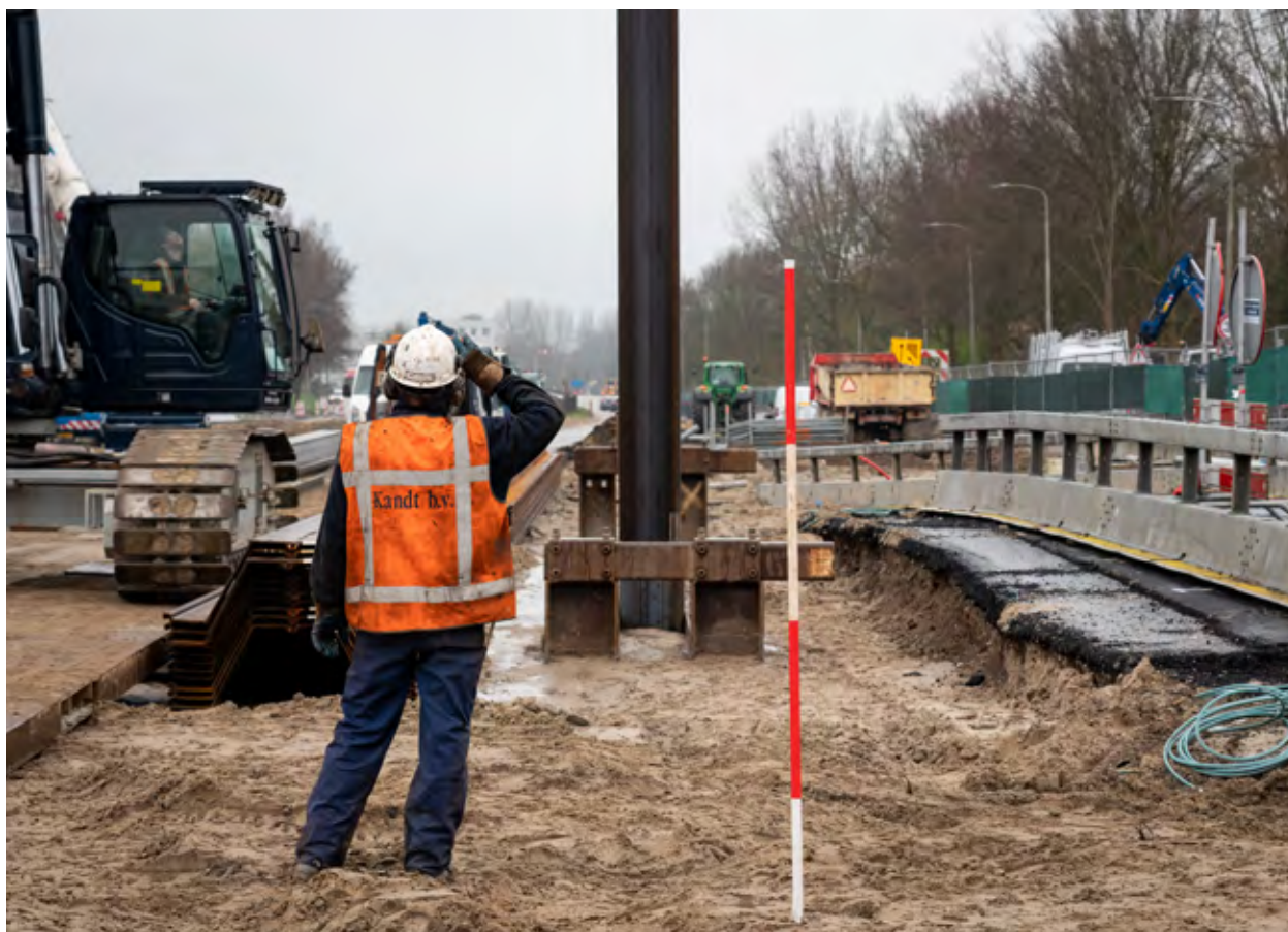
Funderingswerkzaamheden aan de Sportlaan