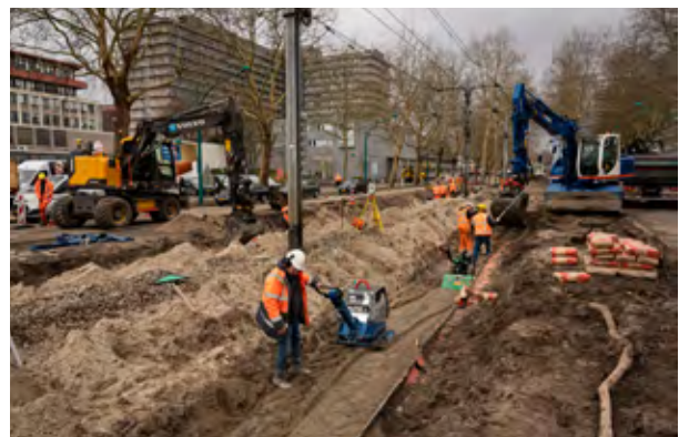
Werkzaamheden tijdens de eerste weekendbuitendienststelling van 9 en 10 maart