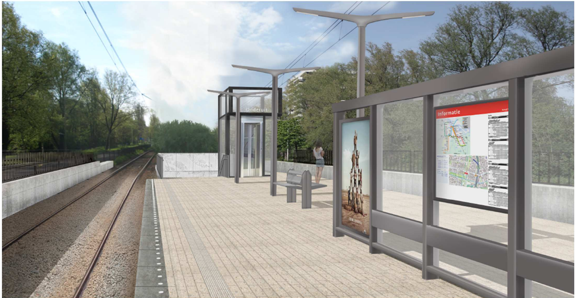
Impressie van halte Onderuit