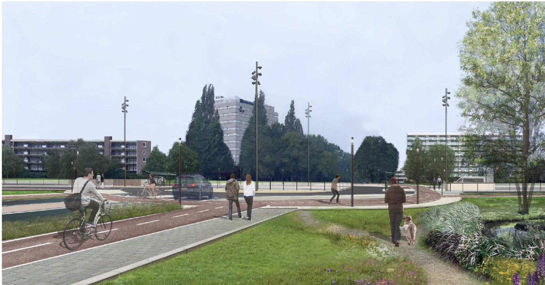
Impressie van kruispunt Kronenburg