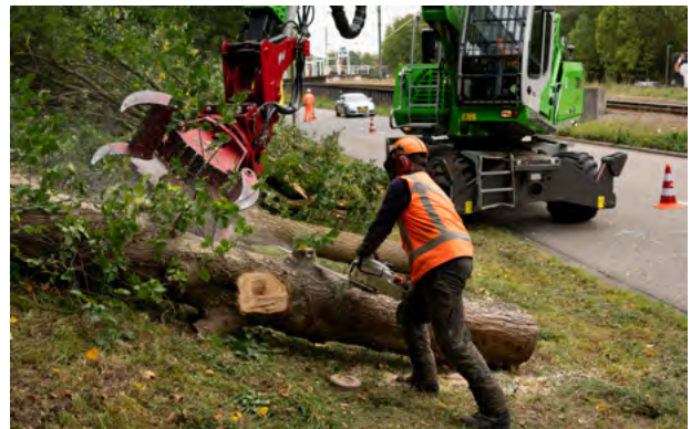
Bomenkap bij de Sportlaan om ruimte te maken voor de tijdelijke Beneluxbaan.