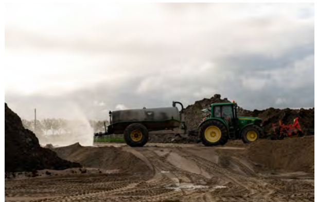
Er wordt zo'n 80.000 kuub zand aangebracht op het opstelterrain.