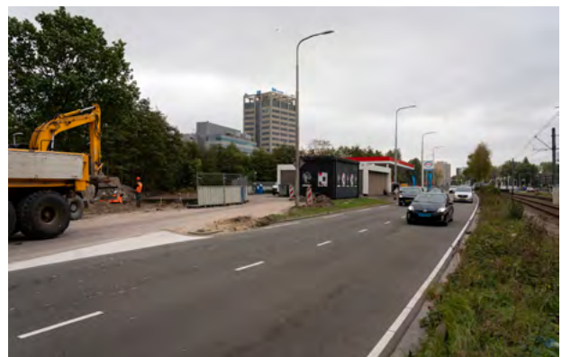
De contouren van de tijdelijke Beneluxbaan bij Kronenburg worden al zichtbaar.