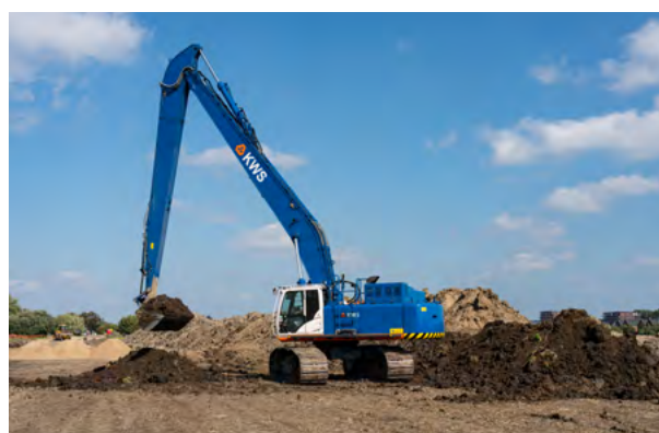
Veel grondwerkzaamheden op het opstelrein.