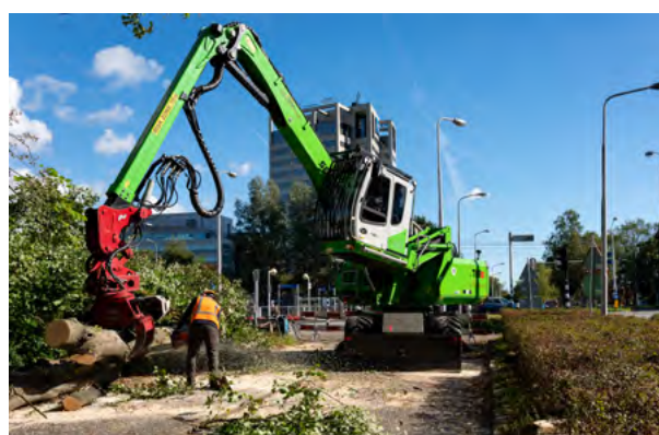
Helaas noodzakelijk: het verwijderen van groen bij Kronenburg.